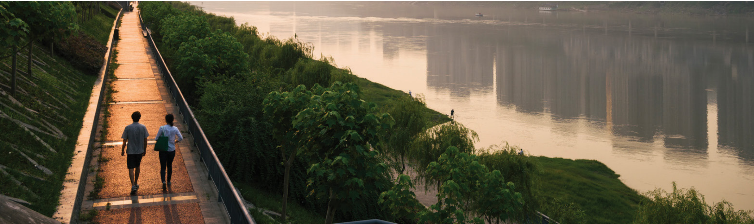
© KEVIN ARNOLD Juli 2015. Sungai Yangtze yang mengalir di sepanjang Tiongkok dan berakhir di Laut Tiongkok Timur di dekat kota bersejarah Shanghai. Conservancy bekerja sama dengan mitra Tiongkok untuk berinvestasi pada konservasi daerah aliran sungai serta terlibat dalam industri tenaga air melalui perencanaan, perancangan, dan pengoperasian dam yang lebih baik lagi.